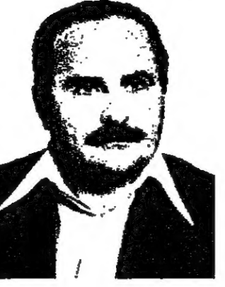
بقلم : شفيق منصور

واضاف : - ان التعاون العربي اليهودي والتقارب والتفاهم بين ابناء الشعيين يعتبر بمثابة حاجز كبير ومدع يرفع راية راكاح في التسلط على الشارع العربي ، سيما وان